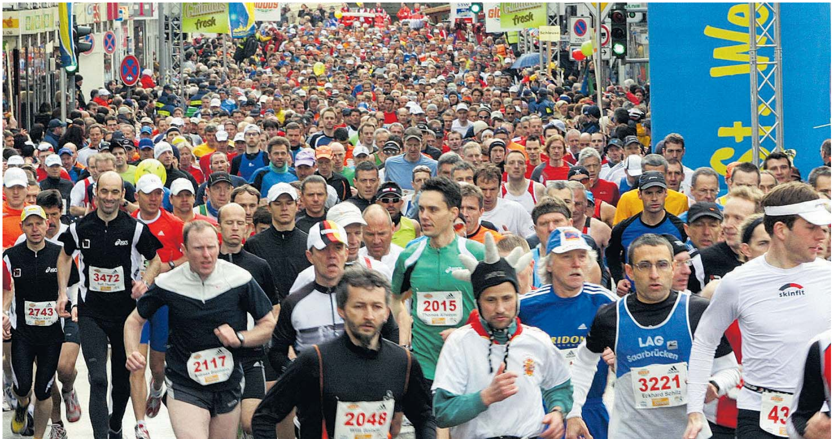
2800 Läufer gingen gestern um zehn Uhr in der St. Wendeler Bahnhofstraße auf die Halbmarathon- oder die Marathon-Distanz.

Produktion dieser Seite: Marcus Kalmes Stefan Regel